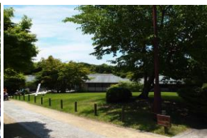
晴天☀に恵まれました