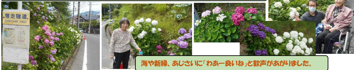
海や新緑、あじさいに「わあー良いね」と歓声があがりました。

アジサイの手入れをされている方が声をかけてくださり、ご挨拶とお話ことができました。私達が見るのはこの時季だけですが、手入れは年中必要とおきし、ありがたみが増しました。