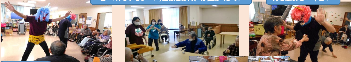
鬼の面・パンツも職員の力作です!