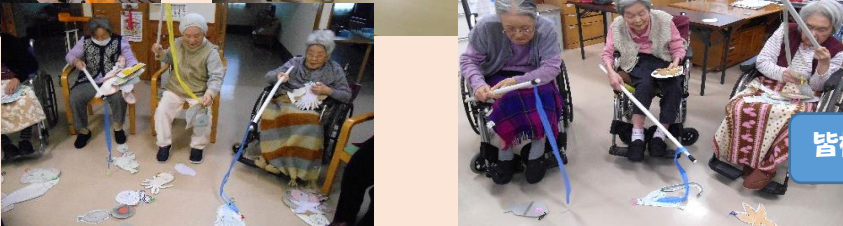
皆様勝負は真剣です。

節分行事がありました! 1年の健康と安全の願いを込め、鬼役の職員に「鬼は外! 福は内!」中には本気で追い払おうとする方もおられ、鬼は泣く泣く退散。また節分にちなみイワシ釣り大会も開催。イワシ以外の魚も多数いますが、