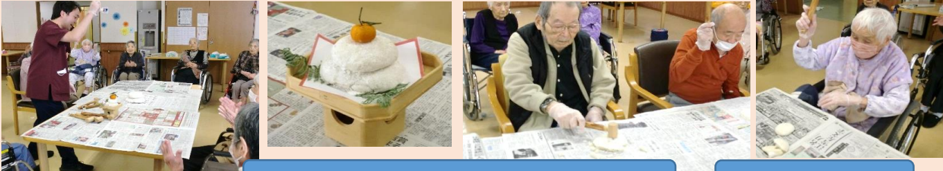
「せーの、よいしょー！」自然とかけ声が上がります!

鏡開きを行いました。鏡餅は餅つき会の際に利用者様に丸めていただいた餅で作成し、年末年始に各フロアに飾っていたものです。この餅は食べれなかった為、麩入りの御汁粉を提供させていただきました。