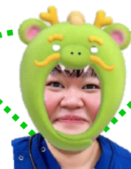
編集の魔術師 (臨床工学技士)