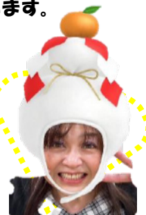
ひらめきの神 (医療事務)