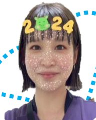
イラストの天才 (看護師)

昨年より青山だよりを他部署の三人で行っております。月末にはアイデアを出し合い、日々の仕事と並行して楽しく作成しております。そんな三人を簡単にご紹介したいと思います。また、今年一年のご愛読をお願いします！