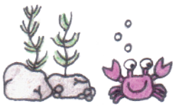
イラストby Ns. 大室