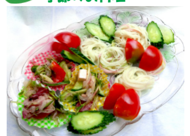
そうめんと夏野菜のマリネ