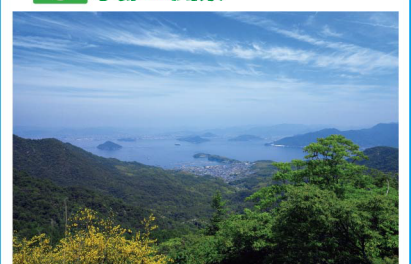
江田島 古鷹山から望む広島湾